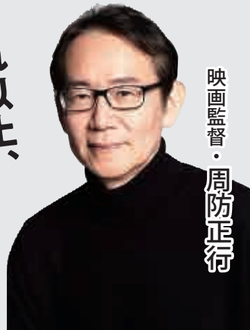
映画監督・周防正行