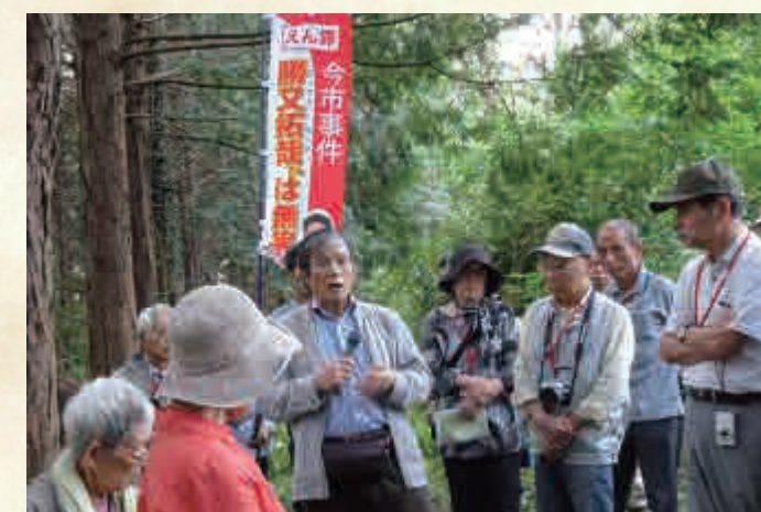
今市事件の矛盾を検証する支援者

高裁判決は弁護団の反証にもとづき、殺害日時、場所、殺害態様の供述部分は信用できないと一審判決を破棄しました。東京高裁は、検察の有罪ストーリーが破綻した以上、無罪判決を言い渡すべきでした。